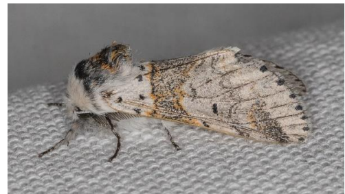
Kleine hermelijnvlinder (PD)