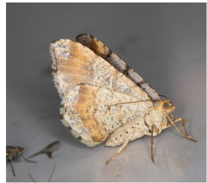
Gerpelde spanner (PD)