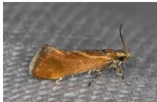
Italiaanse kaneelsikkelmot (PD)