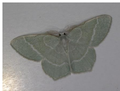
Melkwitte zomervlinder (PD)