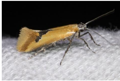
Grote mosboorder (PD)