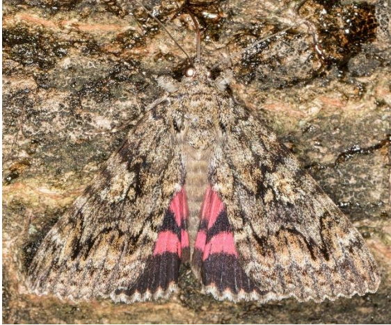
Karmozijn weeskind

We telden in totaal 98 vlinders op smeer. De piramidevlinder was de recordhouder met in totaal 38 exemplaren, gevolgd door de huismoeder met 19 exemplaren. Het meest indrukwekkend waren het rood weeskind en het karmozijnrood weeskind. Dit blijven indrukwekkende vlinders om naar te kijken.