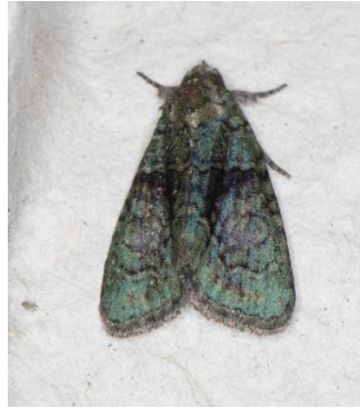
Donkergroene korstmosuil (PD)