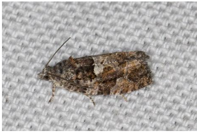
Bonte fruitbladroller (PD)