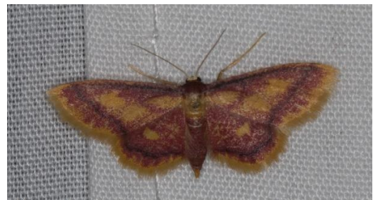
Geelpurperen spanner (PD)